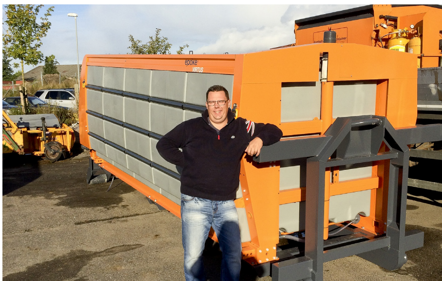
Figur 1. 12½ m³ ny saltlagespredere klar til i fuldtlastet tilstand at trækkes op på lastbilen

Der saltes generelt ikke på yderste 1-1½ meter af vejbanen (undtagelse bl.a. veje med brede kantbaner).